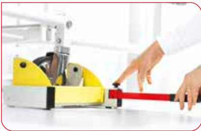
Der patentierte Hebelmechanismus ermöglicht das Einrichten der Lastzellen ohne Kraftaufwand.